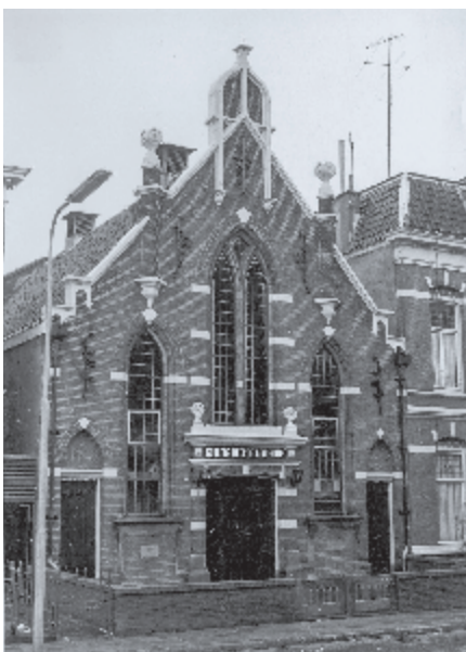
▶ Kerkgebouw aan de Parkstraat.

Arnhem heeft in de loop van de jaren velen zien komen en gaan. Studenten vertrokken na hun studie weer. Jonge stellen verhuisden in verband met school voor de kinderen. De leeftijdsopbouw is ook wat onevenwichtig. We hebben veel jongeren en veel ouderen, de middenleeftijd is ondervertegenwoordigd. Sinds het afscheid van ds. Kattenberg