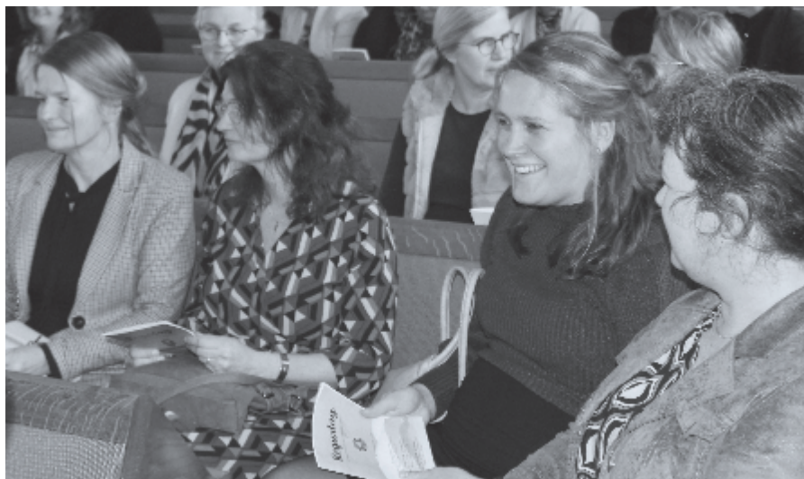
▶ Bezoekers van de regiodag in Barendrecht, 6 februari 2024.

bijzondere dag. Midden in de week een dag van bezinning. Het thema is passend: 'De bezinnende vrouw'. De kerk van Veenendaal zien we graag vol vrouwen van allerlei leeftijd, en vast ook weer tientallen mannen. Vier sprekers, muzikale omlijsting en een forumdiscussie zorgen voor een afwisselend geheel. Leden en belangstellenden: weet u heel hartelijk welkom!