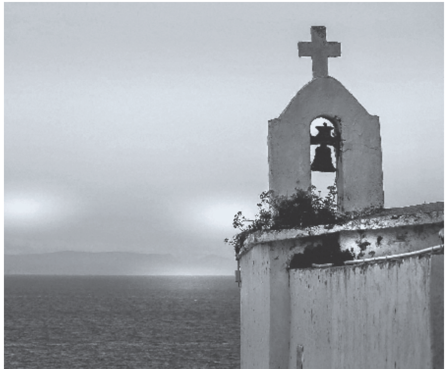
▶ Hij riep met een grote stem over de kruisheuvel van Golgotha: 'Eli, Eli, lama sabachthani?'

zijn 'Waarom?' uitroept, moet in ons doorklinken dat wij de Godsverlating verdiend hebben, eeuwig verdiend, door onze zonden tegen de grote en eeuwige God. Maar Gods bedoeling is hierdoor een weg te banen voor Godsverlaters om weer kinderen Gods te kunnen worden. In dit werk worden al de deugden van Zijn recht, liefde en genade wonderlijk verheerlijkt. Hoor, hoe Gods Zoon Zich door het geloof in de Godsverlating nog aan God vastklampt, terwijl de Vader naam Hem op de lippen bestorven is: 'Mijn God! Mijn God!' zo roept Hij uit als Borg, in de plaats van Zijn bruid, die in de verlating ten onder zou zijn gegaan als Hij haar niet te hulp zou komen. Wie niet verder kan komen dan de verdoemenis te verdienen,