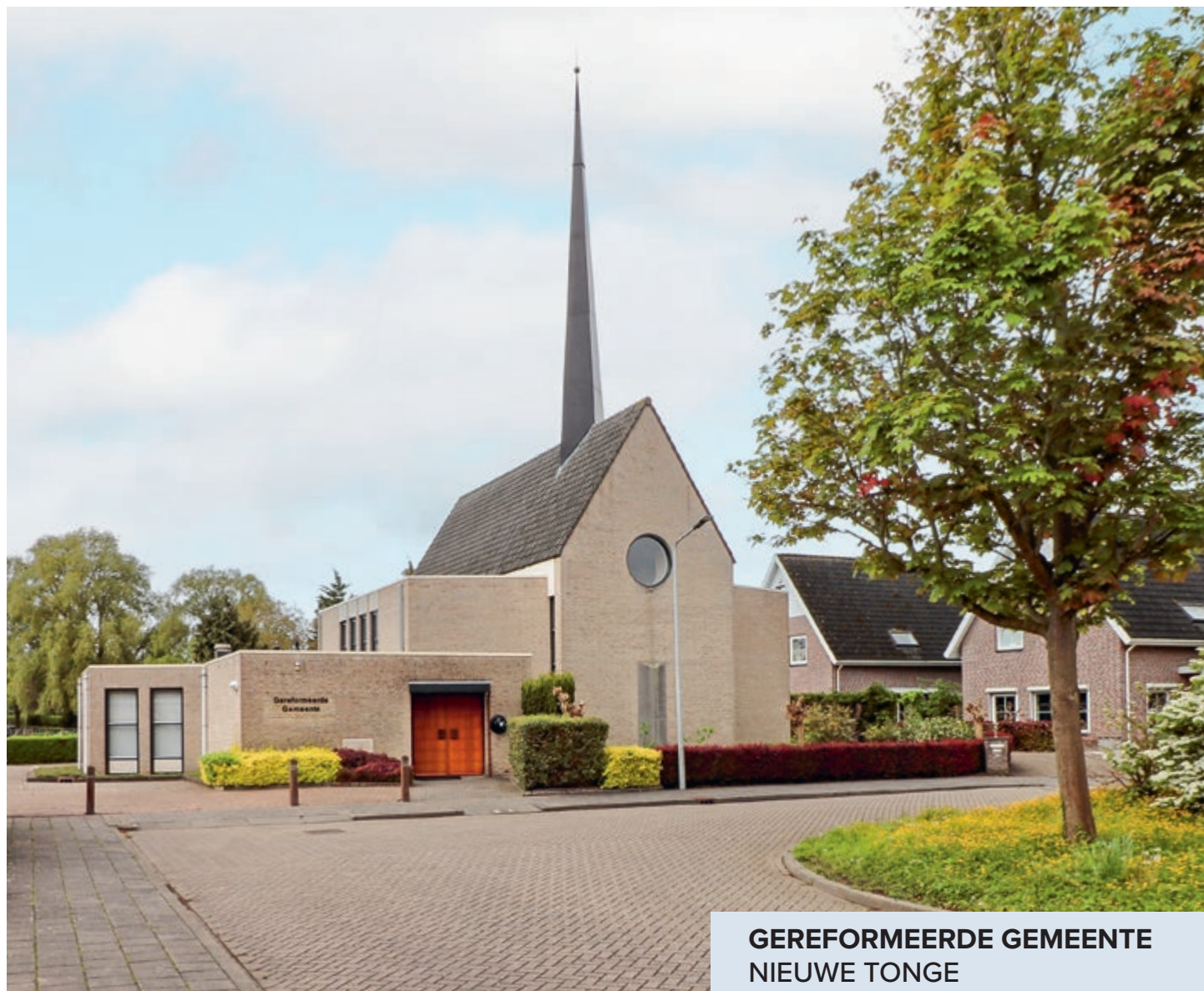
GEREFORMEERDE GEMEENTE NIEUWE TONGE