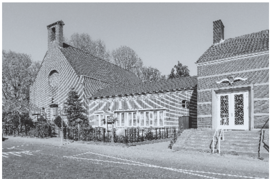
▶ Kerkgebouw aan de Groen van Prinstererstraat.