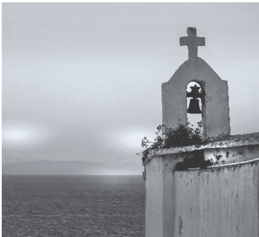
▶ O, hoe diep is Jezus op Golgotha Borgtochtelijk ingedaald in de dorst van Zijn Kerk.

Kinderen van God, dorstenden, hier zo vaak in de woestijn, weet dat er aan de andere zijde van de Jordaan niemand meer zal zeggen: 'Mij dorst!' 'Want het Lam, Dat in het midden des troons is, zal hen weiden, en zal hun een Leidsman zijn tot levende fonteinen der wateren; en God zal alle tranen van hun ogen afwissen'. ♦