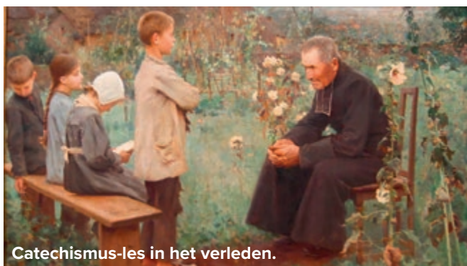
Catechismus-les in het verleden.