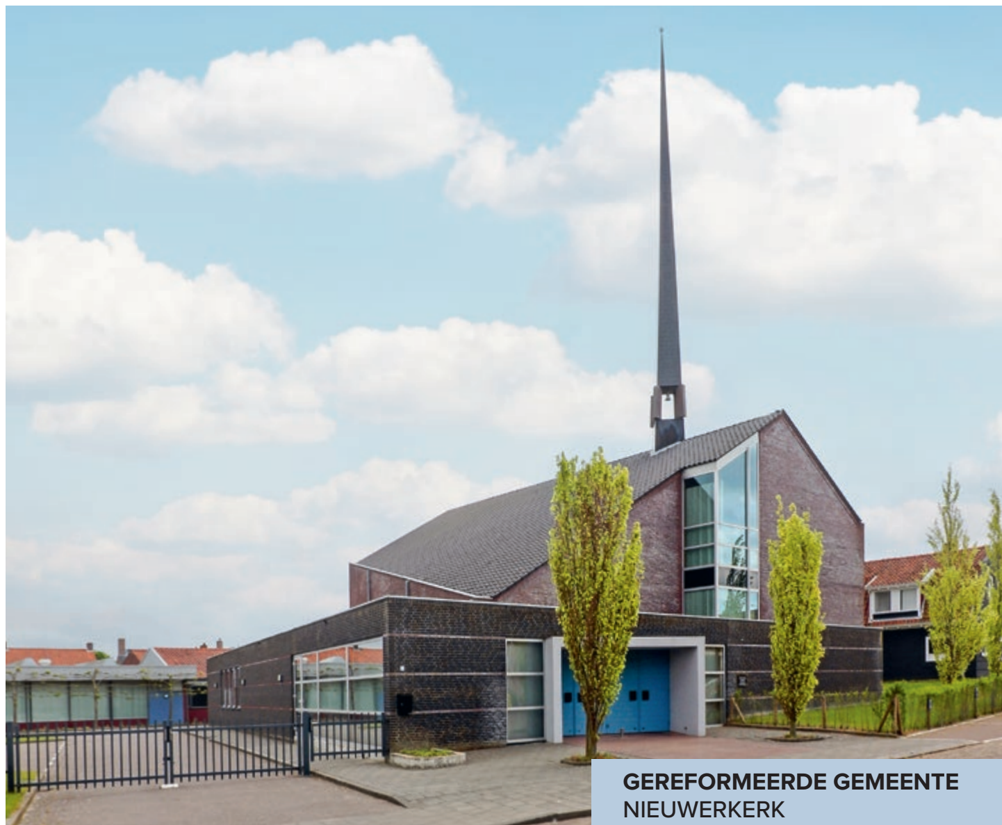
GEREFORMEERDE GEMEENTE NIEUWERKERK