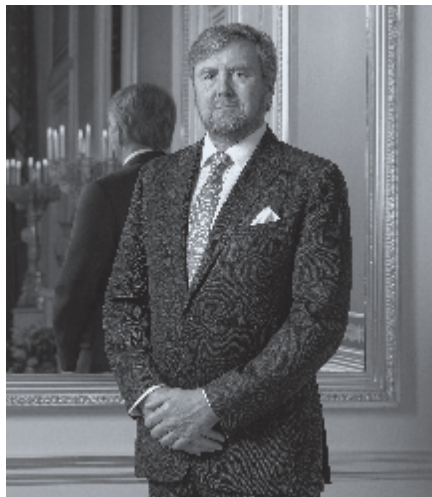
► Koning Willem-Alexander bij de opening van het Nationaal Holocaustmuseum: 'Laten we nooit vergeten: Sobibor begon in het Vondelpark, met een bordje 'Voor Joden verboden'.

Daarom is dit museum ook bedoeld om te voorkomen dat het van kwaad tot erger gaat: de nazi's vermoordden in Europa ongeveer zes miljoen Joden. Dit voor het voetlicht te brengen,