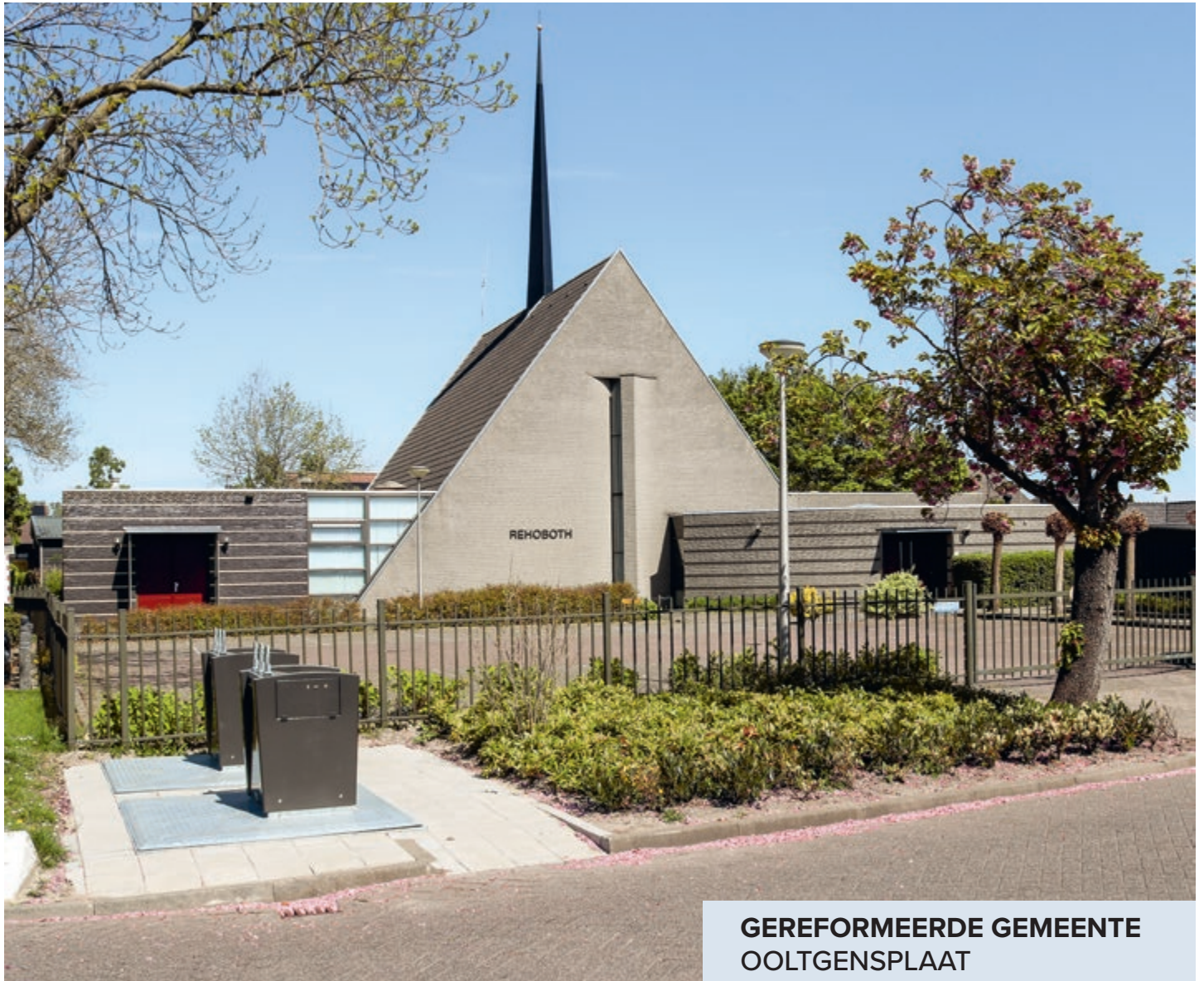
GEREFORMEERDE GEMEENTE OOLTGENSPLAAT