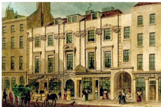
▶ Winkelstraat City of London, 1831