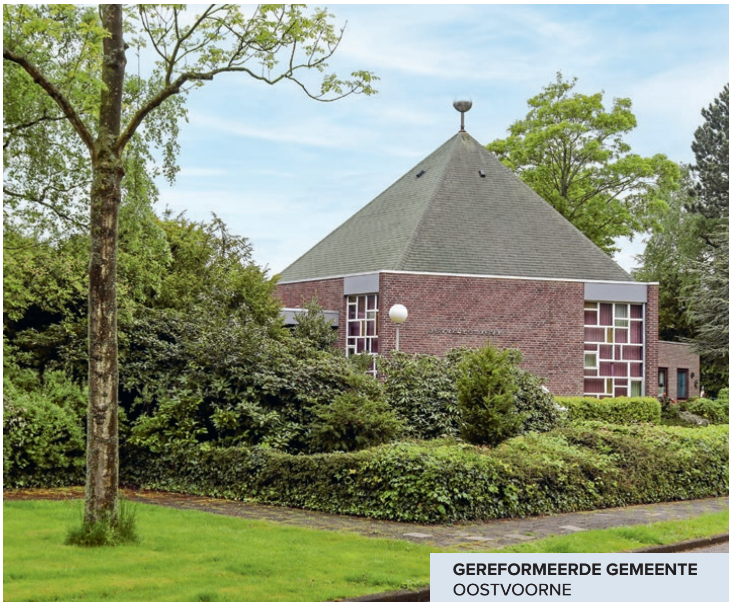
GEREFORMEERDE GEMEENTE OOSTVOORNE