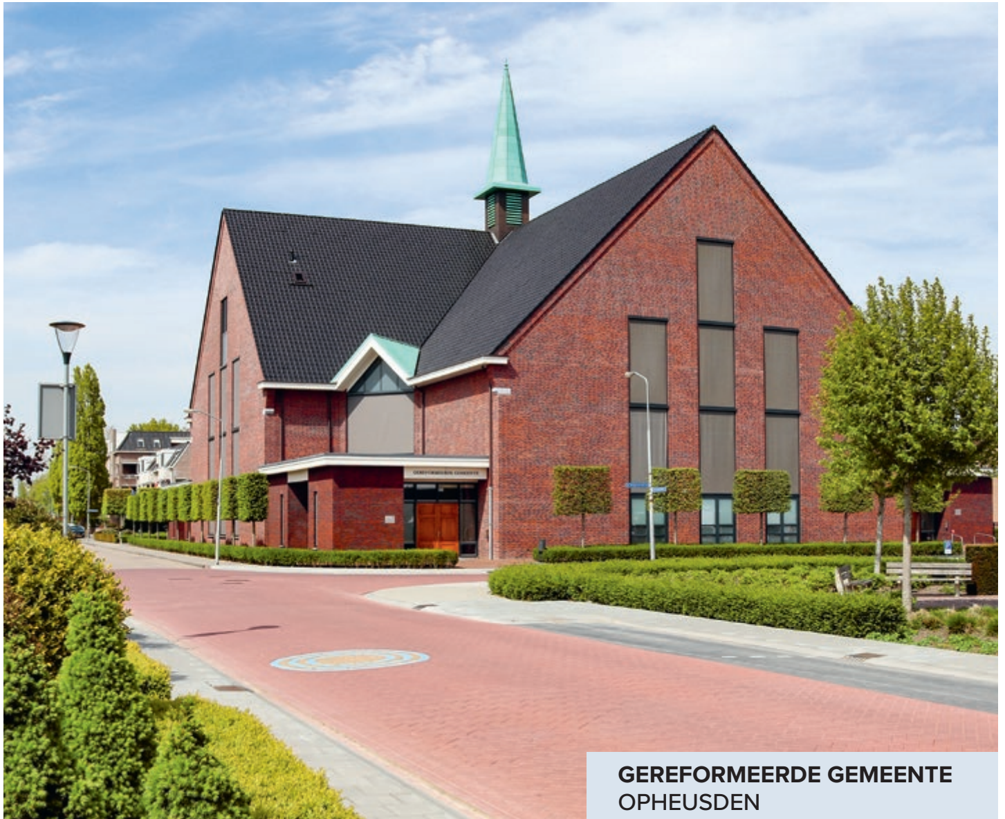
GEREFORMEERDE GEMEENTE OPHEUSDEN