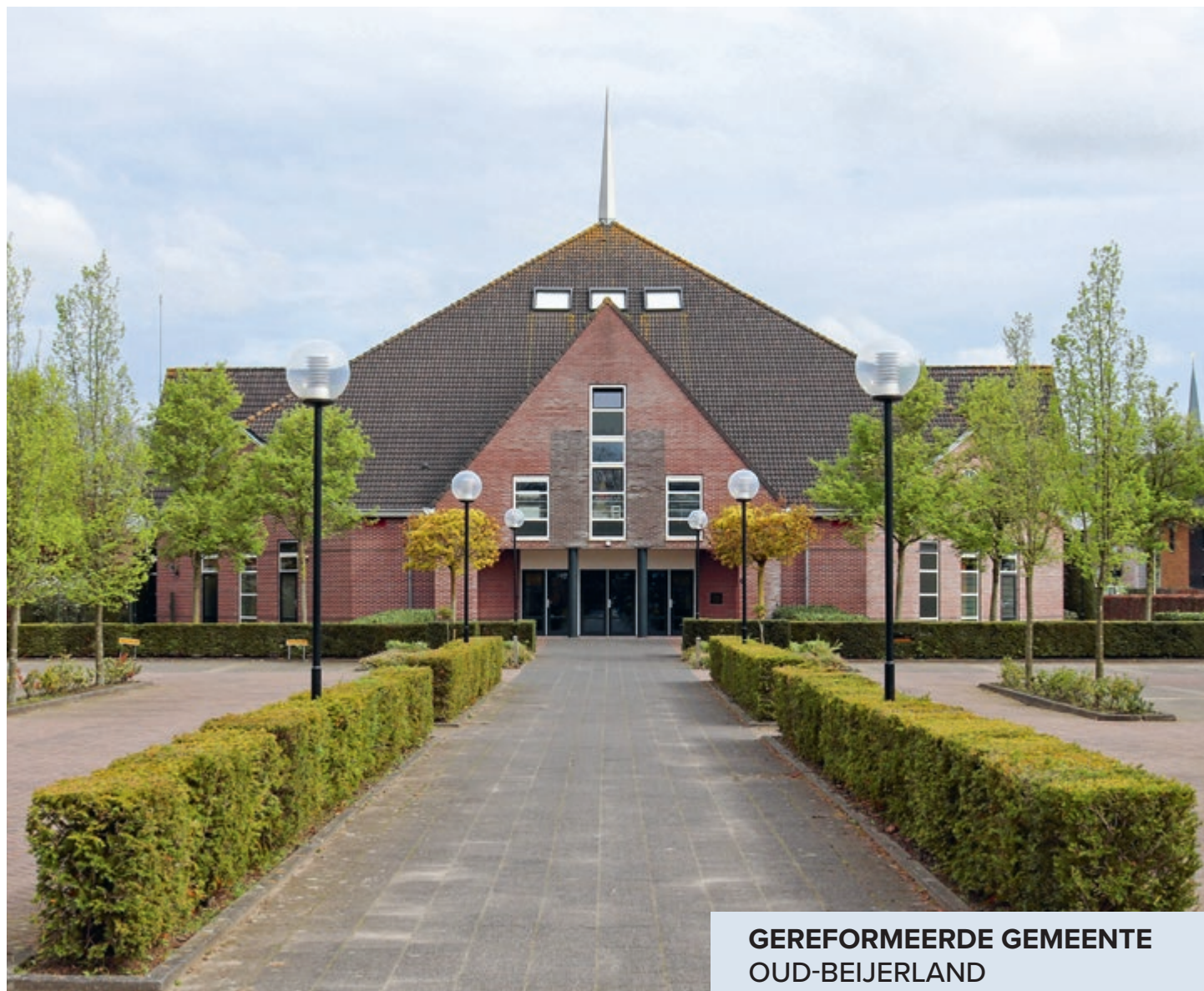
GEREFORMEERDE GEMEENTE OUD-BEIJERLAND