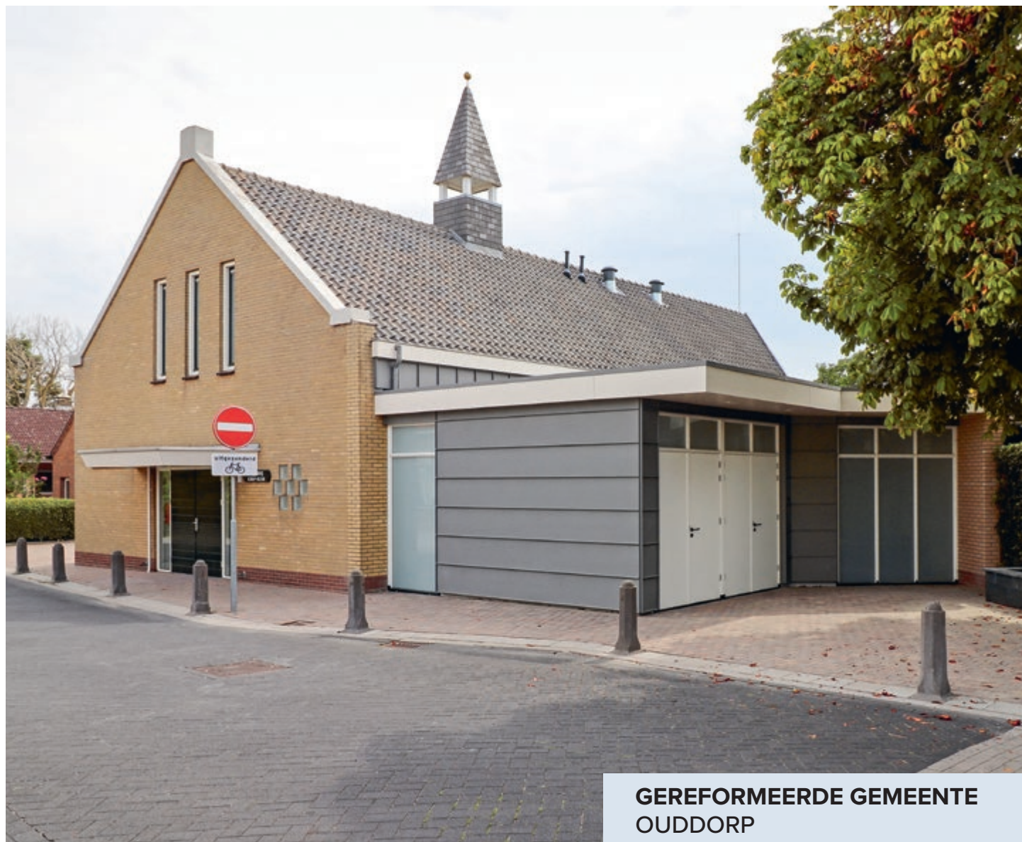
GEREFORMEERDE GEMEENTE OUDDORP