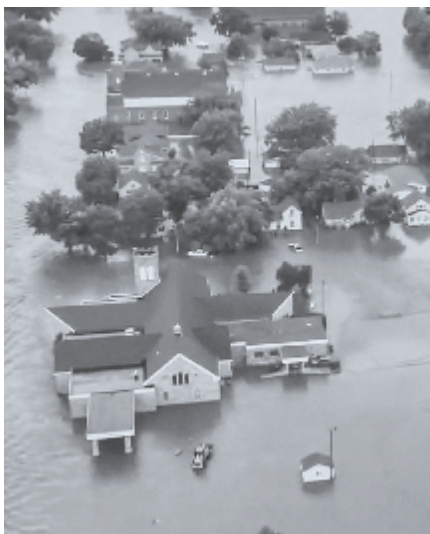
▶ Overstroming te Rock Valley.

Op zaterdag 22 juni teisterde een overstroming de gemeente van Rock Valley. U heeft er in het Reformatorisch Dagblad over kunnen lezen. Na hevige regenval begaf een dam het en de gevolgen zijn in veel gevallen diepingrijpend geworden. Vele huishoudens kregen in die nacht van vrijdag op zaterdag, rond de klok van twee uur, slechts enkele luttele minuten de tijd om hun huis zo spoedig mogelijk te verlaten vanwege het snel stijgende water. De berichten die ons sindsdien bijna dagelijks bereiken, zijn ronduit heftig. Tientallen gezinnen uit de gemeente van Rock Valley zijn alles kwijtgeraakt. Wat waterschade is, weten zij die het meegemaakt hebben. Het mag een wonder heten dat er geen verlies van mensenlevens te betreuren is.