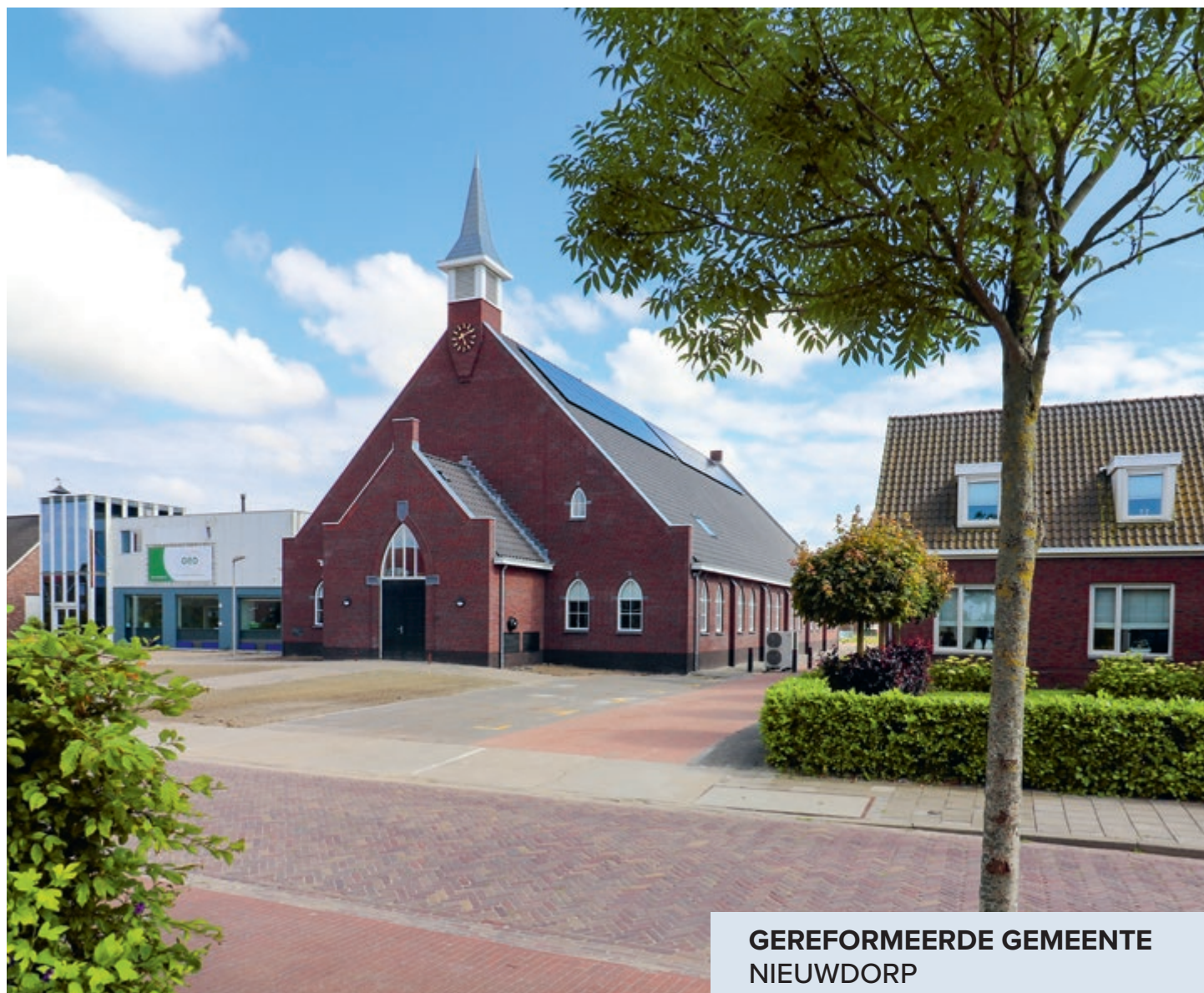
GEREFORMEERDE GEMEENTE NIEUWDORP