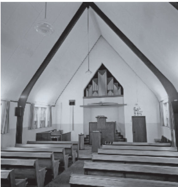
► Kerkinterieur in Akkrum.