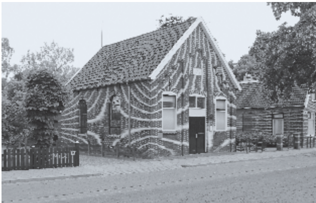
► Het voormalige kerkgebouw in Wierden.