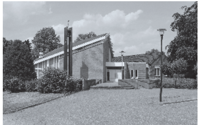
► De 'nieuwe' Aa-kerk in Aadorp.