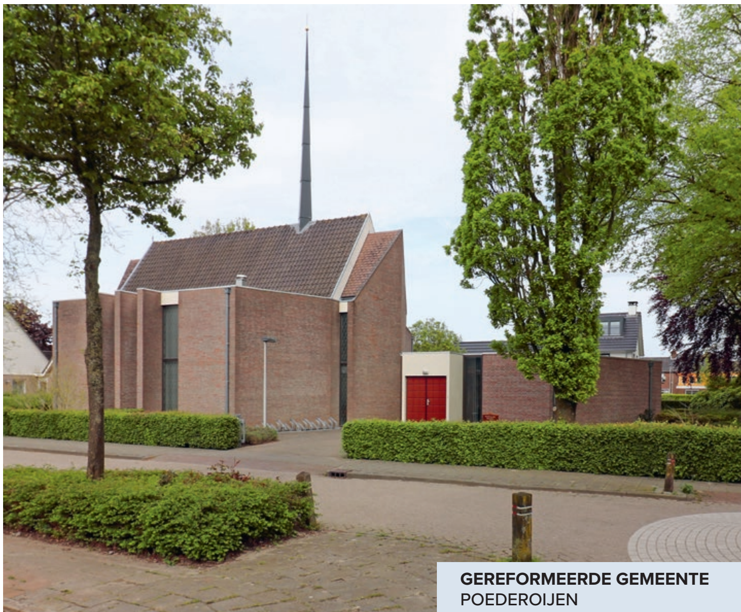
GEREFORMEERDE GEMEENTE POEDEROIJEN