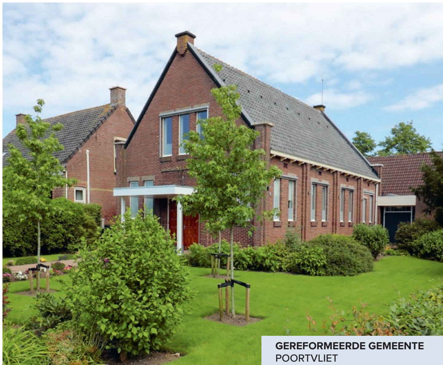
GEREFORMEERDE GEMEENTE POORTVLIET