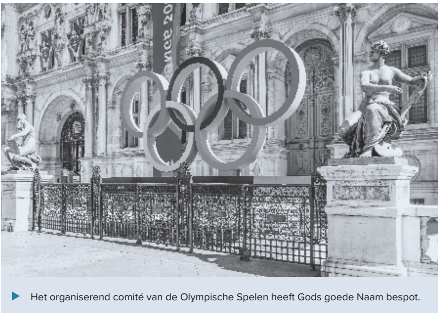
► Het organiserend comité van de Olympische Spelen heeft Gods goede Naam bespot.

Daar, in het Evangelie, ligt immers de kracht van het christendom! Beter gezegd, daarin ligt het hart van de christen. Het beste wapen tegen de verwording in politiek, cultuur en maatschappij, juist als de Naam van Christus wordt aangetast, is het Evangelie van Jezus Christus en Die gekruisigd. Dat mag en moet uitgedragen worden tegen alle revoluties in. Toch het Evangelie. ♦