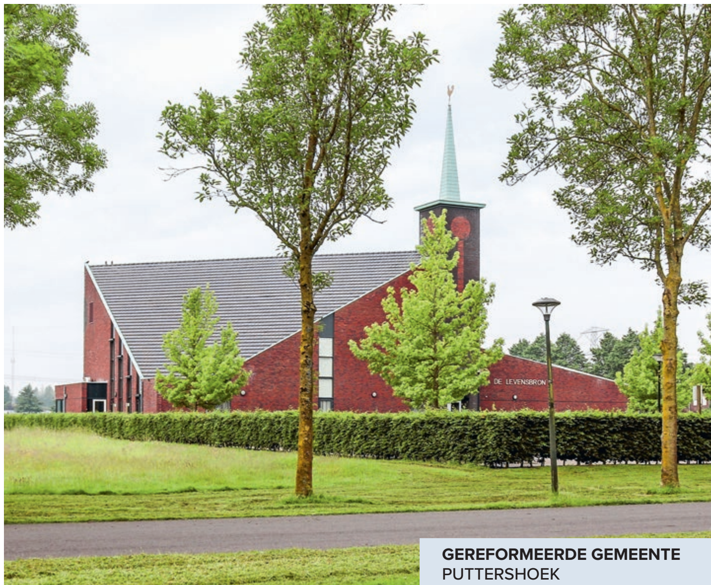
GEREFORMEERDE GEMEENTE PUTTERSHOEK