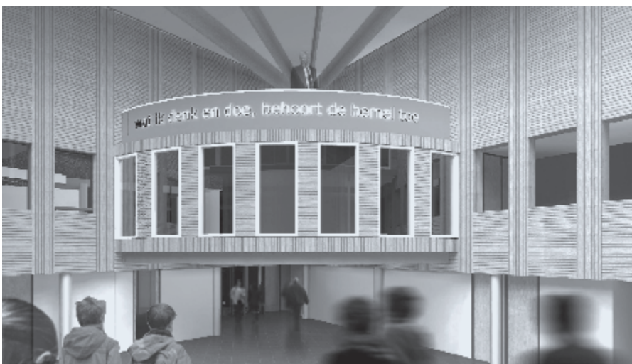
▶ 'Wat ik denk en doe, behoort de hemel toe'. Deze veelzeggende spreuk heeft op elke locatie van het Van Lodensteincollege een plaats gekregen.