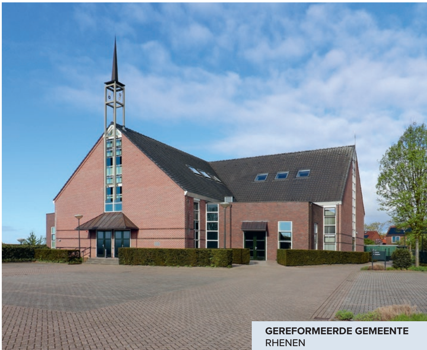
GEREFORMEERDE GEMEENTE RHENEN