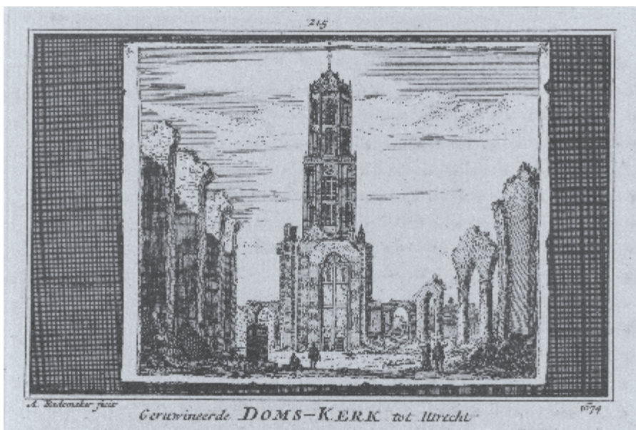
► Het middenschip van de Domkerk stort als een kaartenhuis in elkaar.

Overigens betekent dit niet dat in Utrecht het Avondmaal niet meer bediend wordt, want zijn ambtsbroeders nemen deze diensten van hem over. Van Lodensteins zorg betreft niet alleen het sacrament van het Heilig Avondmaal, ook de doopraktijk roept vragen op. Die vragen hebben vooral betrekking op de levenshouding en de godsdienstige kennis van de ouders die hun kind ten doop willen houden. De doopraktijk was ruim: ieder kind mag gedoopt worden, onafhankelijk van de vraag hoe de ouders leven of hoe hun relatie tot de kerk is. Van Lodenstein blijft de Doop echter wel bedienen. Hij stelt de Doop soms wel uit en geeft de ouders die weinig of geen kennis hebben van de christelijke leer eerst privéonderwijs. Bijbels onderwijs is van levensbelang! ♦