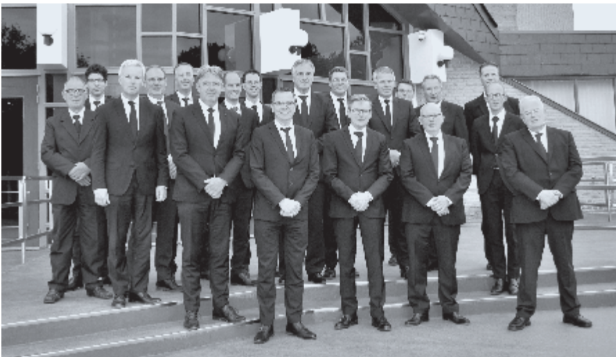
▶ Kerkenraad GG Goes juli 2024

Gij hemel, aard’ en zee, vermeldt Gods lof; Laat al wat leeft Zijn trouw en goedheid prijzen; Want God zal aan Zijn Sion hulp bewijzen, En Juda’s steên herbouwen uit het stof. Daar zal Zijn volk weer wonen naar Zijn raad, God eeuwig hun Zijn volle gunst betonen; Daar zullen zij, Gods knechten met hun zaad, Zij die Zijn Naam beminnen, erf’lijk wonen. ♦