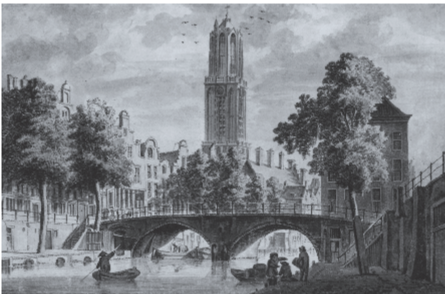
▶ Van Lodenstein kan in zijn levenspraktijk ascetisch genoemd worden. Toch stond hij met beide benen in de samenleving. Hij kende de stad Utrecht.

Van Lodenstein wist zich van God en Zijn Woord afhankelijk. Dat kenmerkte zijn levenshouding. Tegelijkertijd was die bewuste instelling het beslissende vertrekpunt voor leer en leven. Deze dingen maken hem tot een voorbeeld ter navolging. Daarbij moeten we ons ook realiseren dat hij geen volmaakt man was. Hij nam zijn beslissingen als een zondig mens, met zijn eigen karakter, maatschappelijke positie en dus ook zijn beperkte zienswijze. Daarom mogen we hem niet op een voetstuk zetten, maar het is ook niet nodig om zijn eigenaardigheden breed uit te meten. We mogen hem zien als een voorbeeld in Gods kerk en in de samenleving. Hij was een ingetogen man, die vaak zorgen had over veel van wat hij zag en hoorde. Hoezeer hij de nadruk legde op het innerlijke leven, toch had hij oog voor de medemens en voor zijn kerkelijke en maatschappelijke omgeving. Als predikant, schrijver en dichter heeft hij invloed mogen uitoefenen op het geestelijk leven van mensen. Verenigd te zijn door het geloof in Jezus Christus en als vrucht daarvan te mogen en -met vallen en opstaan- te kunnen leven tot eer van Zijn heilige Naam: het waren de grote doelen waarvoor hij leefde en waartoe hij zich geroepen voelde. Van Lodenstein legde veel nadruk op de heiliging van het leven, in het diepe besef dat het werk van de Heilige Geest daarbij noodzakelijk is. Dat is in onze tijd niet minder nodig! ♦