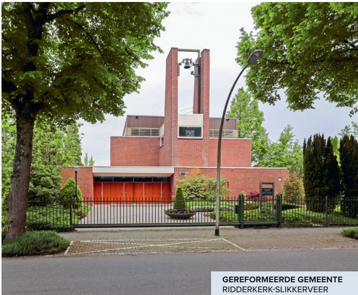
GEREFORMEERDE GEMEENTE RIDDERKERK-SLIKKERVEER