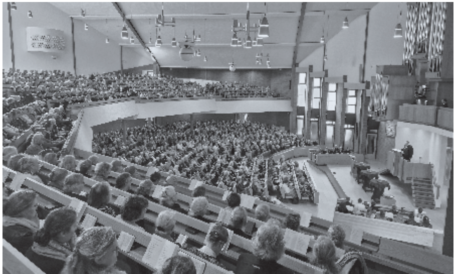
► Overzichtsfoto bondsdag 2024

We kijken ook vooruit op het VBBG-seizoen. Een jaarvergadering, drie regioavonden en de bondsdag staan op het programma. Alles met als doel vrouwen te verbinden rondom Gods Woord. De bondsdag is op dinsdag 8 april in Veenendaal. Het thema is dan 'Eenzaam, ik?!' Noteer de datum alvast in de agenda. ♦