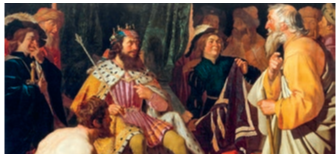
► Solon antwoordt Croesus.