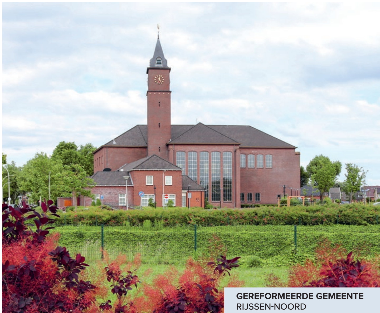
GEREFORMEERDE GEMEENTE RIJSSEN-NOORD