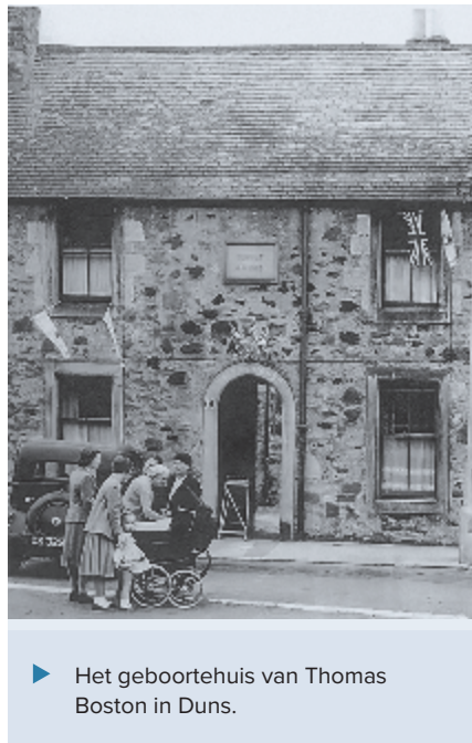
► Het geboortehuis van Thomas Boston in Duns.

Thomas Boston werd voor uitbrekende zonden bewaard, maar geraakte toch in verkeerd gezelschap. Gods Geest gaf in zijn consciëntie indrukken van dood en eeuwigheid, waardoor hij inzag op de verkeerde weg te zijn. Maar met zijn verloren staat voor God was hij volledig onbekend. De godvruchtige opvoeding van