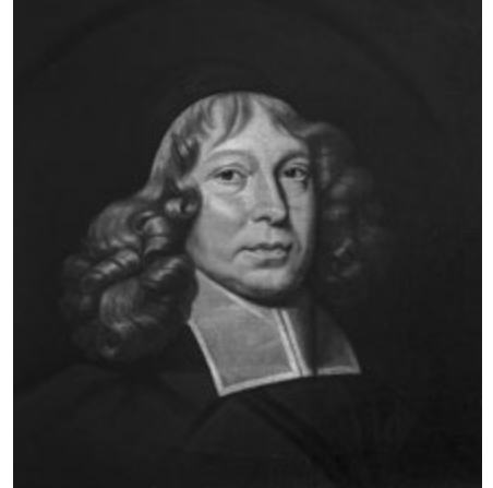
▶ Samuel Rutherford.

Door ongefundeerde klachten over zijn levenswijze, kwam er aan zijn studie abrupt een einde. Was het deze crisis die zijn leven stilzette? Hij had wel, zoals hij later in een van zijn brieven opmerkte, 'geleden van de hitte van de zon die zo hoog aan de hemel stond'. 'Zijn reputatie was geschonden, maar wat belangrijker is, Samuel werd door God vernederd'.