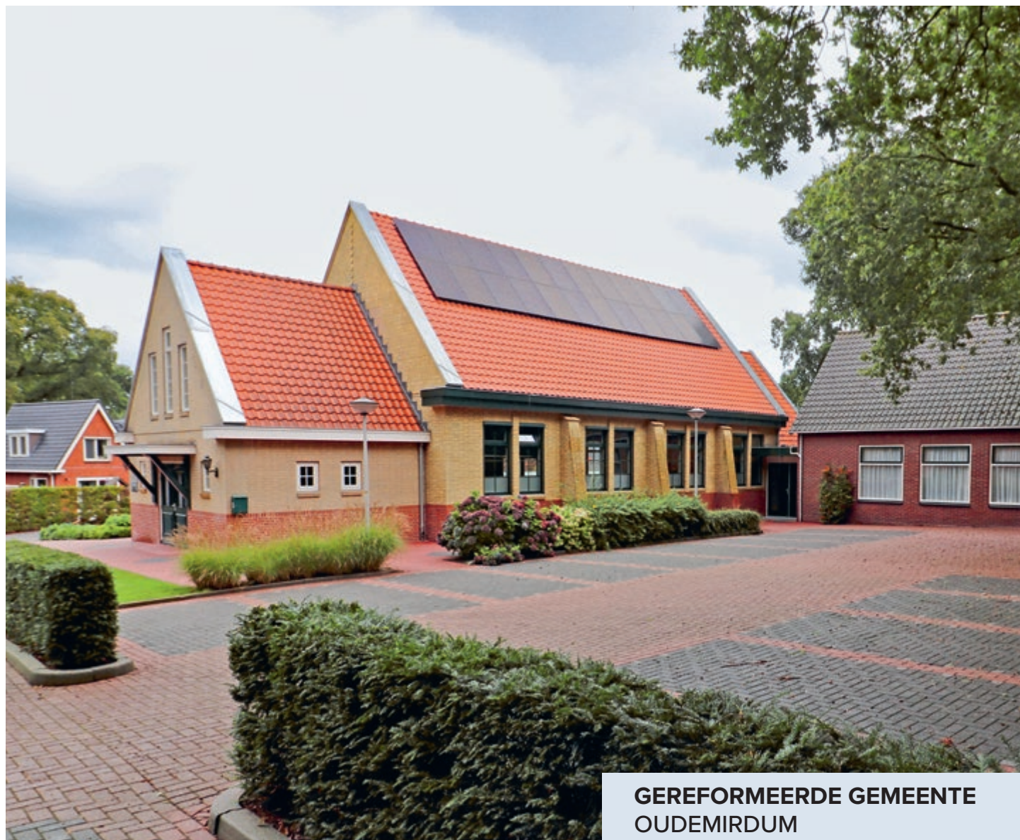
GEREFORMEERDE GEMEENTE OUDEMIRDUM