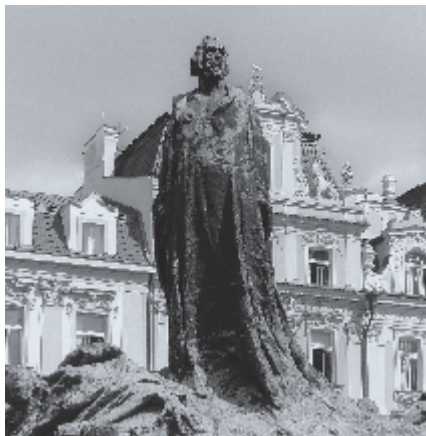
► Johannes Hus is bekend geworden als een van de voorlopers van de Hervorming. Foto: het standbeeld van Hus in Praag.

Hus hield zijn bezwaren niet voor zichzelf. In zijn onderwijs aan de studenten en tijdens zijn preken sprak hij erover. Dat kon niet zonder gevolgen blijven. De machtige Rooms-Katholieke Kerk accepteerde niet dat er mensen waren die bezwaren hadden tegen de kerkelijke leer. Hus werd als priester afgezet, hij moest Praag verlaten en kon dus geen professor meer zijn. De zwaarste kerkelijke straf werd over hem uitgesproken: hij werd in de ban