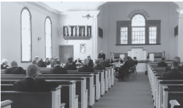
▶ De Generale Synode van de Netherlands Reformed Congregations was in Grand Rapids bijeen.

Migrantenkerken en 'moederkerken' kunnen door de grote afstand in tijd en plaats en door een andere culturele context gemakkelijk uit elkaar groeien. Opnieuw mochten we tijdens deze Synode opmerken dat het hier anders was. Niet alleen kennen we als zustergemeenten dezelfde historische wortels, daarbij vasthoudend aan dezelfde leer en belijdenisgeschriften, ook het zoeken naar hetzelfde bevindelijke leven verbindt aan elkaar. Voorzichtig mogen we opmerken dat we in dat opzicht misschien zelfs wel meer naar elkaar toe groeien dan uit elkaar. De nood der tijden dringt daartoe. ♦