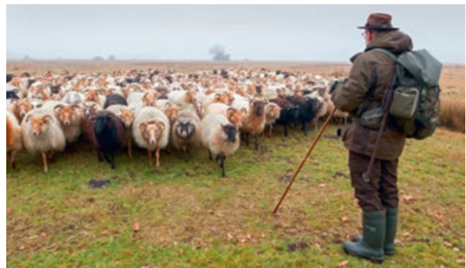
P.C. Beeke, Middelburg