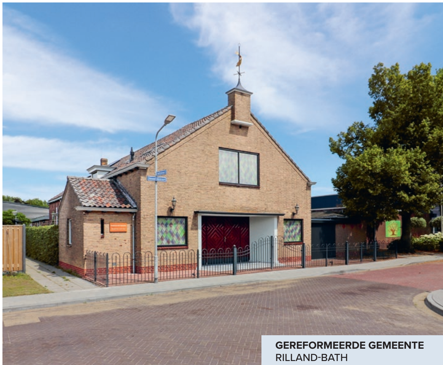
GEREFORMEERDE GEMEENTE RILLAND-BATH