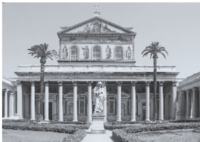
▶ Standbeeld van Paulus voor de Paulusbasiliek te Rome.

In het vervolg van zijn toelichting op dit gedeelte van de Galatenbrief komt de vergelijking met Paulus nog duidelijker naar voren: ‘Inderdaad, niet minder dan Paulus zelf, verstrikt in verachting en lastering van Christus en Zijn Evangelie, en dat zeg ik voornamelijk van mijzelf’. Deze zondaren, zo schreef hij, zijn erger dan hoeren en tollenaars. Die hebben weet van hun verkeerd gedrag en voelen vaak schuld. Maar dat is bij de genoemde huichelaars heel anders: ‘Zij geven dat alles [hun huichelarij] uit voor een hoogst aangenaam offer voor God. Ze bewonderen het als hoogste heiligheid’.