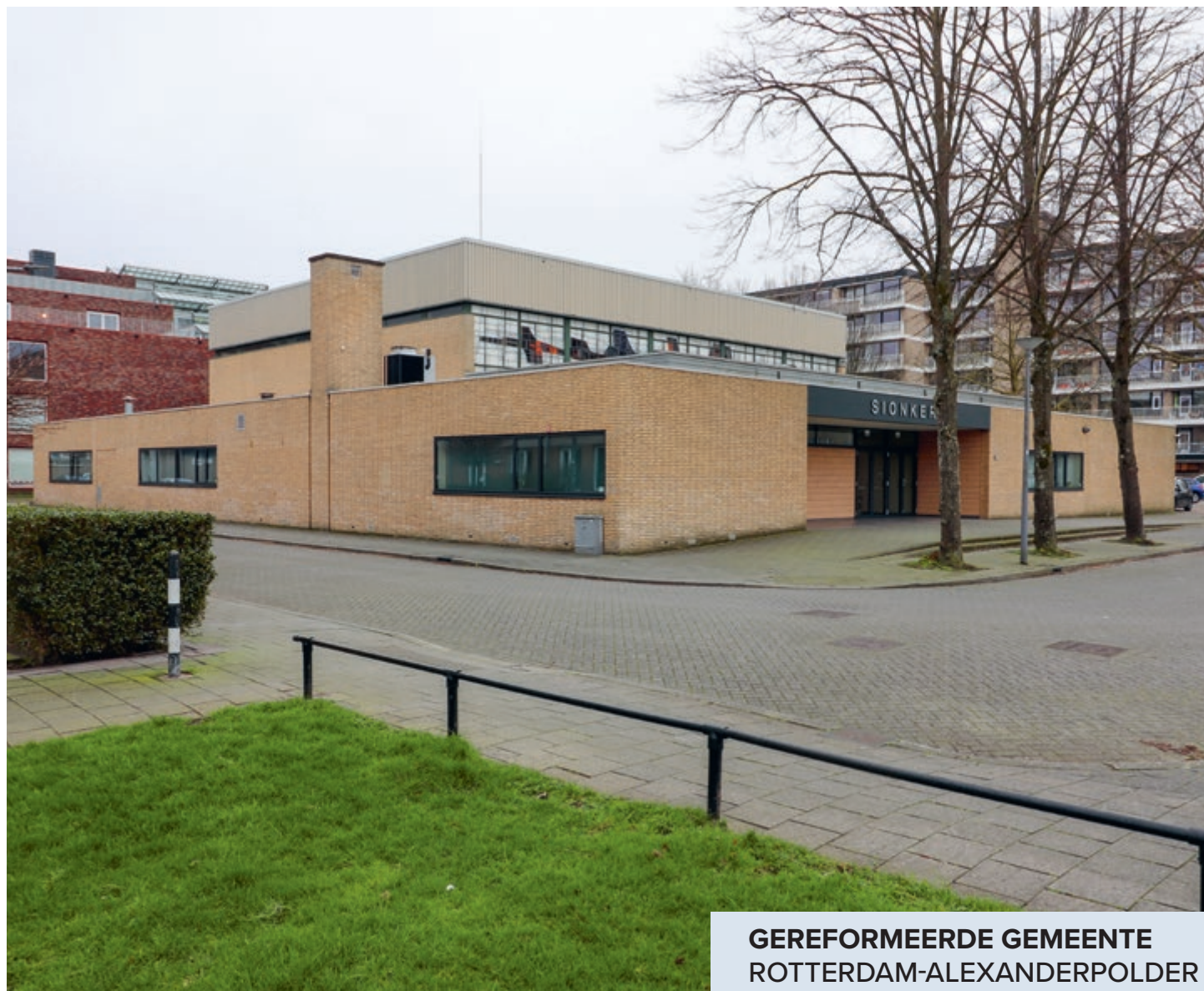
GEREFORMEERDE GEMEENTE ROTTERDAM-ALEXANDERPOLDER