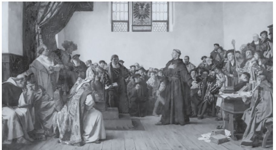
▶ Luther moet zich verantwoorden op de Rijksdag in Worms.

Tussen twee haakjes: ook de onder ons bekende oudvaders waren deze opvatting toegedaan. Zo kunnen we lezen in het bekende boek van Wilhelmus à Brakel "Redelijke Godsdienst" in het hoofdstuk over de rechtvaardigmaking: 'Die hier dwaalt, die dwaalt tot zijn eeuwig verderf. Daarom legt de duivel gedurig daarop toe, om de