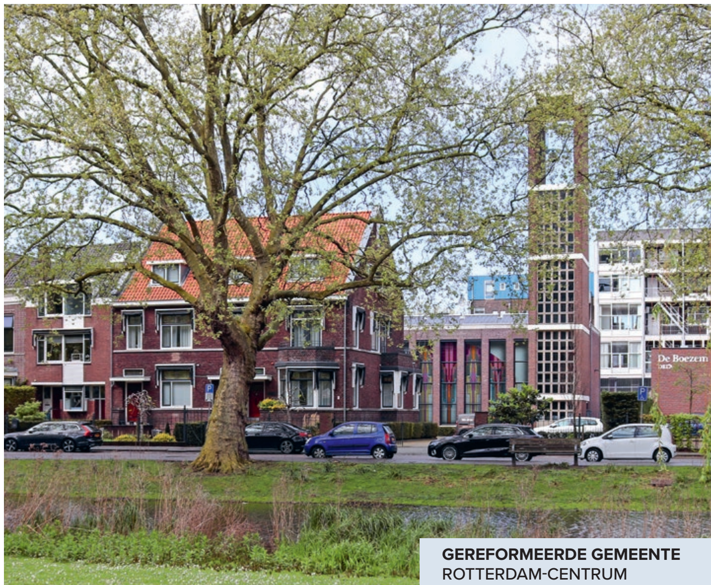
GEREFORMEERDE GEMEENTE ROTTERDAM-CENTRUM