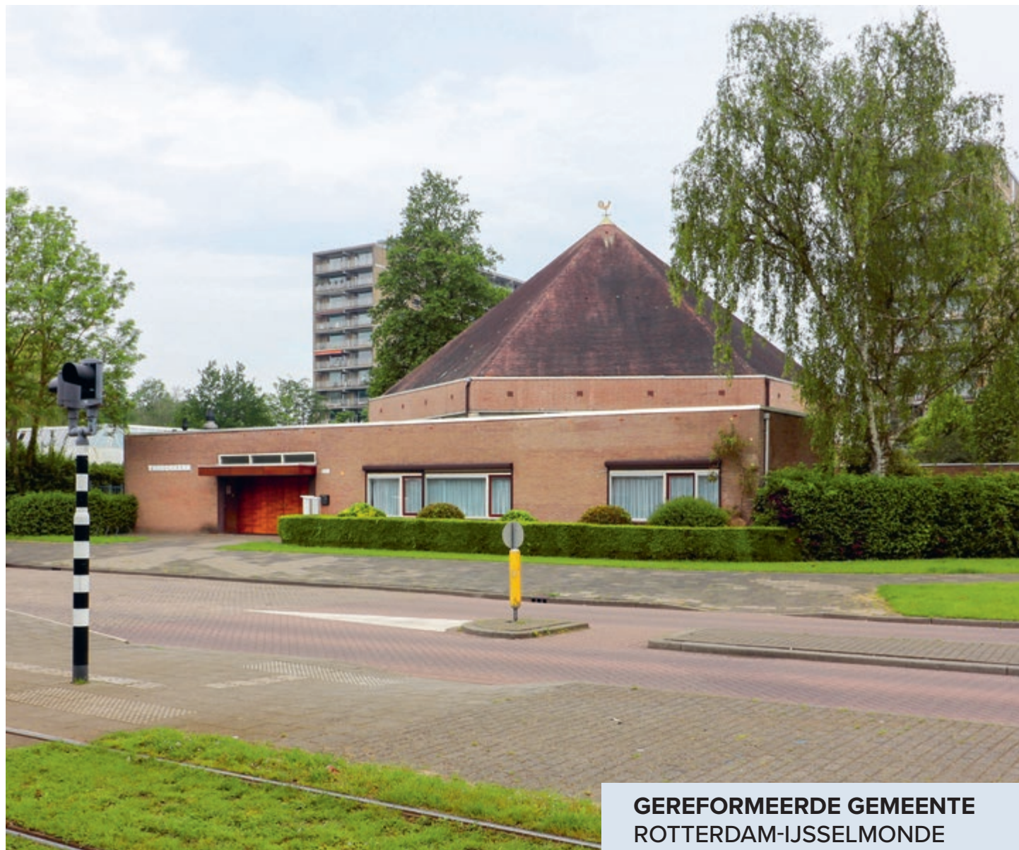
GEREFORMEERDE GEMEENTE ROTTERDAM-IJSSELMONDE