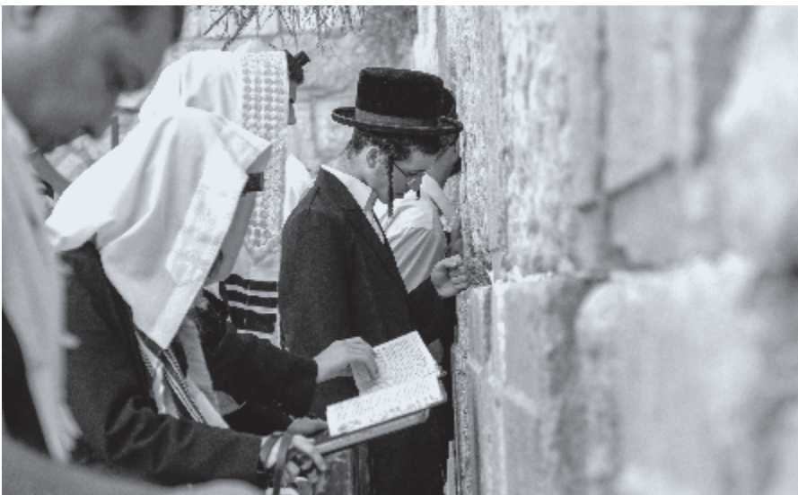
▶ De Joodse traditie kent 613 geboden en verboden.

Door het onderhouden van dit ene gebod en de zes verboden zou ieder