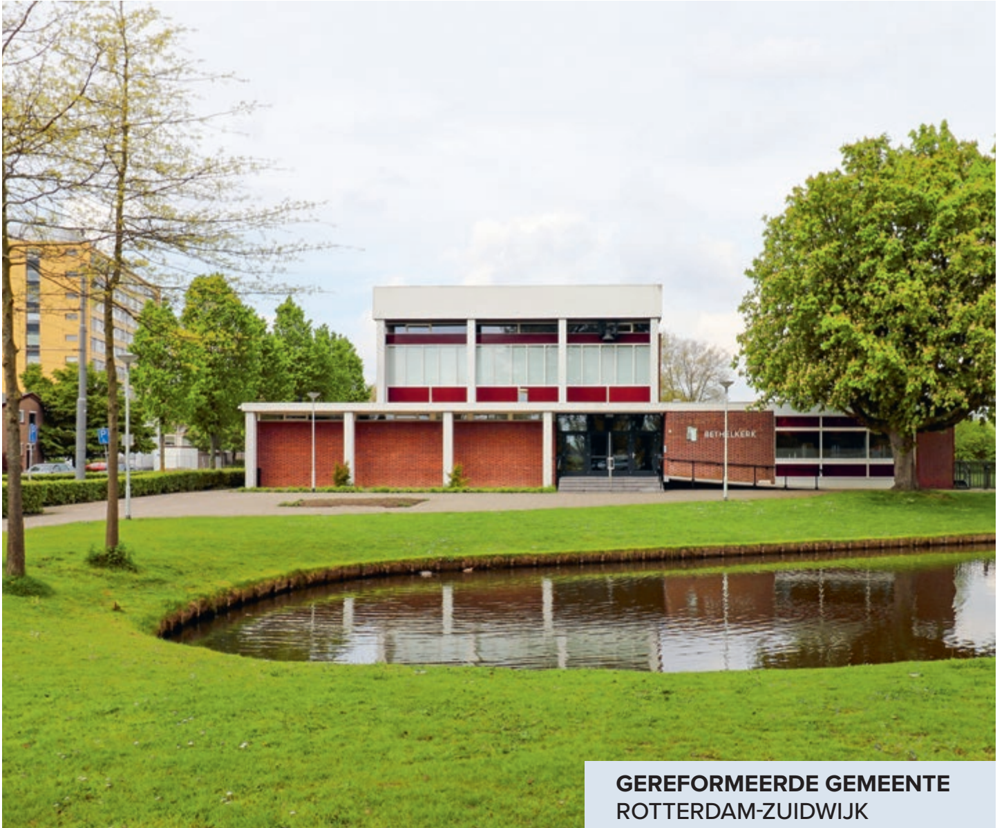
GEREFORMEERDE GEMEENTE ROTTERDAM-ZUIDWIJK