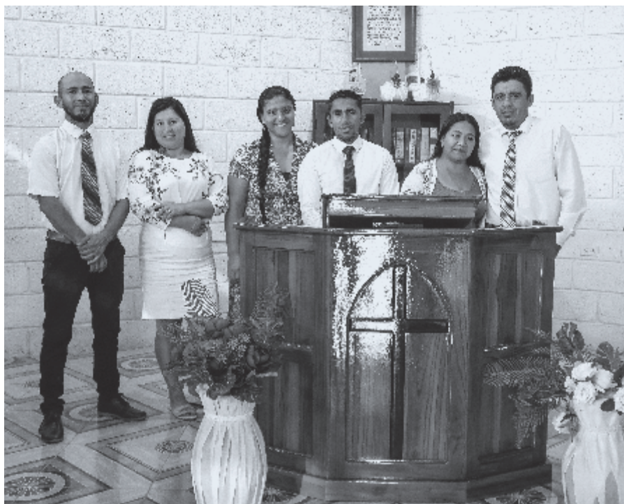
▶ In Portoviejo, Ecuador, is een deel van Gods kerk te vinden. De drie kerkenraadsleden van de gemeente Buenas Nuevas en hun vrouwen poseren in hun kerkgebouw (2024).

In het volgende artikel onderzoeken we de aandacht voor de volken en de opdracht tot de wereldwijde Evangelieverkondiging in de Dordtse Leerregels. ♦