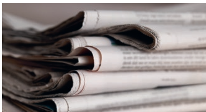
P.C. Beeke, Middelburg