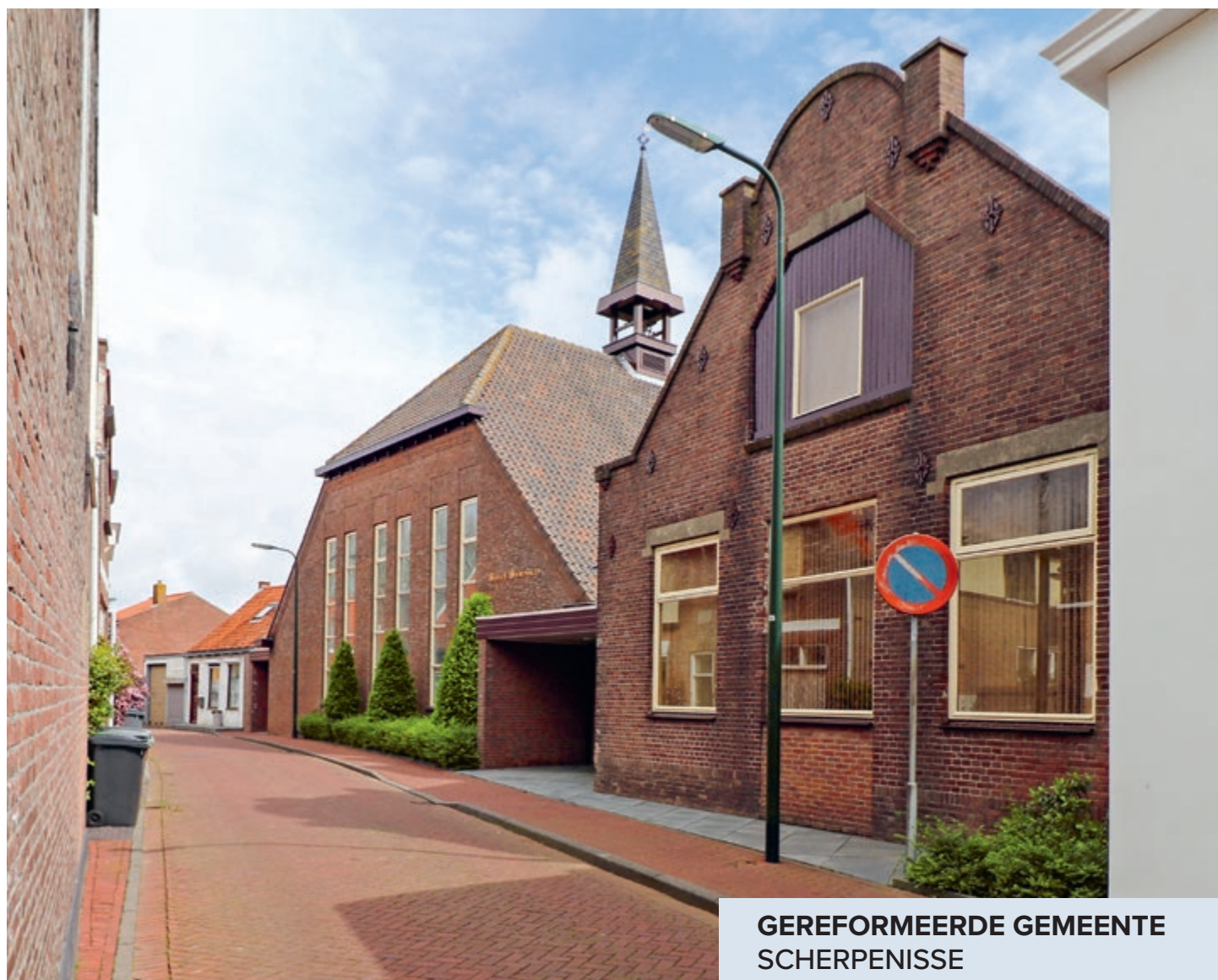
GEREFORMEERDE GEMEENTE SCHERPENISSE